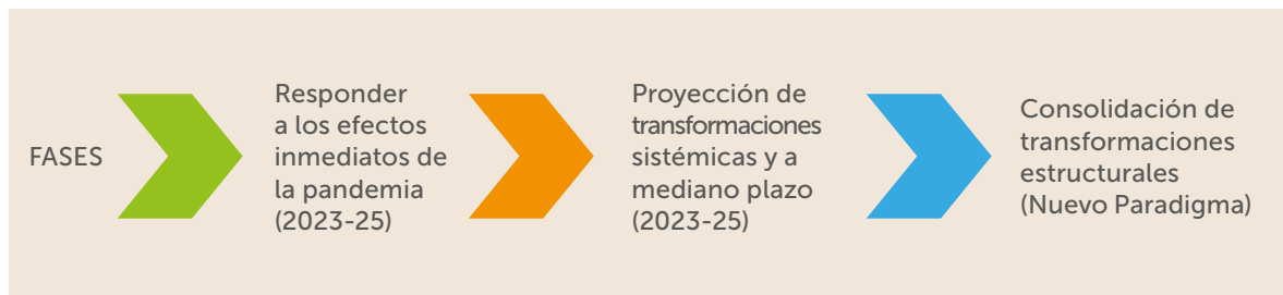
Figura 1. Fases de la Política de Reactivación Educativa Integral

3.- Consolidación de transformaciones estructurales, que se inicia el 2025, abordando una planificación en mayor detalle, con una proyección de al menos 8 años.