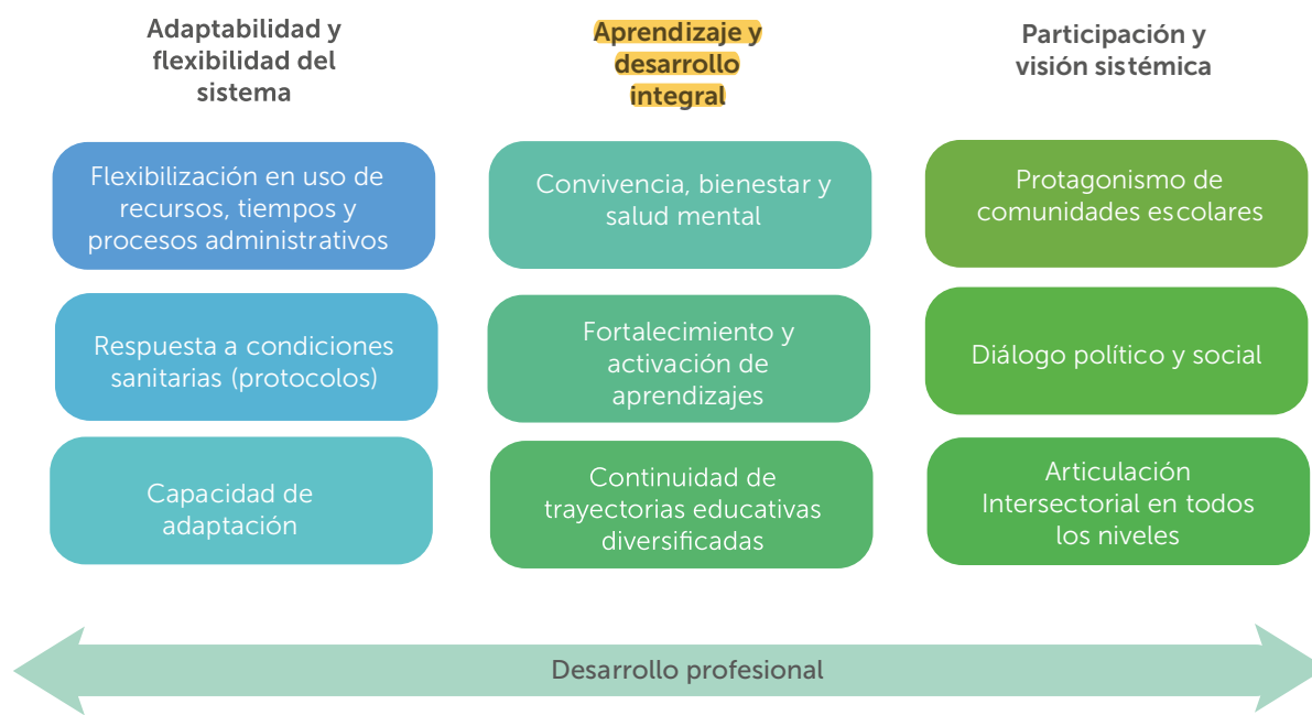
Figura 2. Pilares de la reactivación educativa